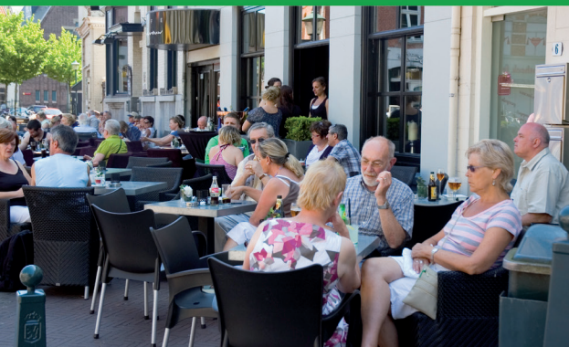
Van harte welkom

Welkom in Hulst Vestingstad, Zeeuws Vlaanderen op z'n best! Iedereen voelt zich graag welkom. Als bezoeker, om deel te nemen aan activiteiten of evenementen, om lekker te shoppen, te wandelen of uit eten te gaan. Hulst wil voor iedereen wat bieden. Voor jong en oud en zeker ook voor mensen met een handicap of aandoening. Toch is dit -bijvoorbeeld voor mensen met een rolstoel- niet zo vanzelfsprekend. Daarom maakte het Bezoekersmanagement Hulst deze speciale brochure. De informatie is ook op de website van Bezoekersmanagement Hulst www.inulst.nl te vinden.